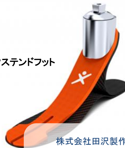
エクステンドフット