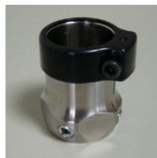
GUPT-FCLAMP クランプ (チタン製)