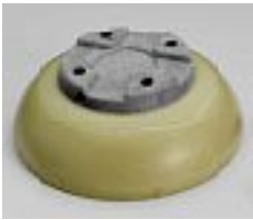
OWW-700-200 ソケットブロック