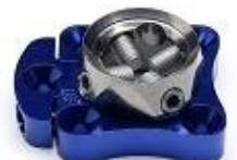
OWW-228002 4ホール回旋付 ピラミッド (メス)