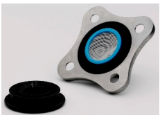
OWW-700-SP471 サクションピラミッド