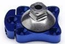
OWW-228003 4ホール回旋付 ピラミッド (オス)