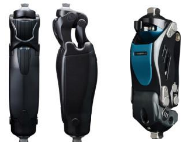
アルクス シンフォニー