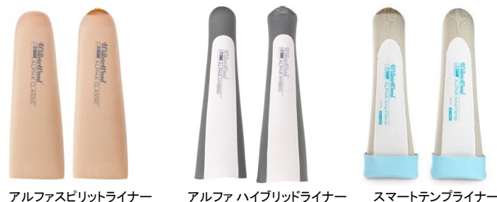
アルファスピリットライナー アルファハイブリッドライナー スマートテンブライナー