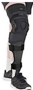
アラードAFOと併用時